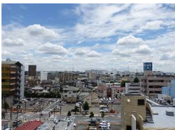
日当たり良好の明るいお部屋 最上階なので開放感があります