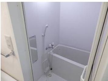
水回りは清潔感に気を付けています