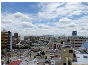
日当たり良好の明るいお部屋 南側開放感があります