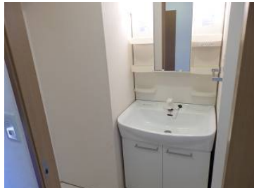
ワイドタイプの洗面化粧台設置