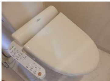
新品温水便座洗浄機付