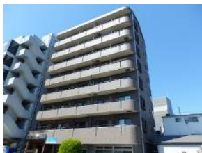
南東側バルコニーで日当たり良好