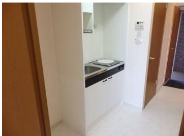
キッチン部分も広めでゆとりがあります