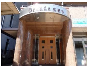
分譲のような重厚感のあるエントランス