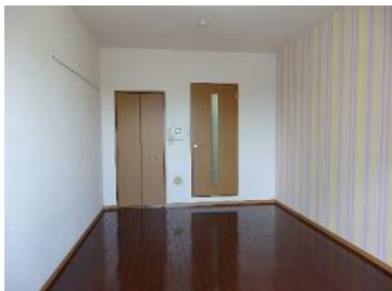
天井が高く明るい室内です