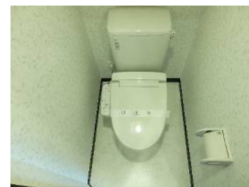
温水洗浄便座付のトイレ