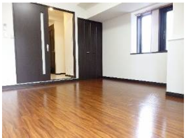
茶色で落ち着いた建具・床 天井が高めです