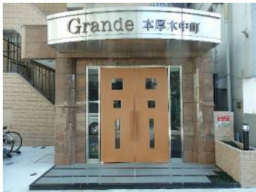
重厚感があり分譲のようなエントランス