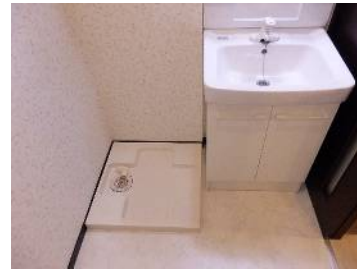
水回りは清潔感を意識しています