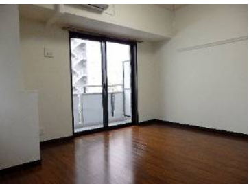
バルコニー側に公園があります