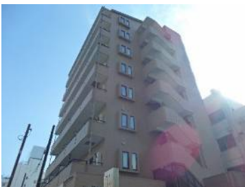
バルコニー側公園で開放感があり日当たり良好