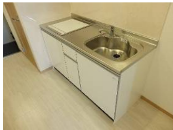
キッチン部分も広めで2口IHヒーター