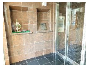
エントランス内はキレイに飾っています